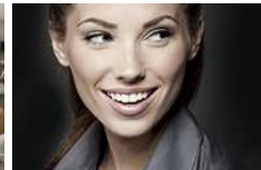
יש לי כסף פנוי להשקעות נדל"ן, מאיפה מתחילים?