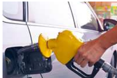
כרטיס האשראי החדש שמעניק לכם החזר