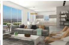
20,000 ש"ח לריהוט ברשת ביתילי לרוכשים דירה