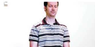
מה למדתי כששתקתי מאת: שמואל מרחב 10:48

פישר ישוב לרכוש דולרים? // הדולר ממשיך להיחלש למרות הורדת הריבית: איבד 6.5% בחודש וחצי