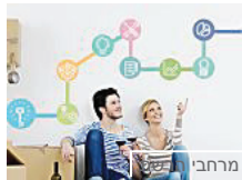
מרחבי לאומי בלוג רכישת דירה - הוצאות שכדאי להתכונן אליהן