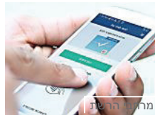
מרחבי רשת וואלה! בלי ארנק: אפליקציה תאפשר תשלום בסמארטפון