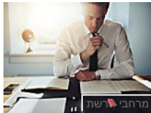
מרחבי רשת TheMarker LABELS מקור ראשון: הרגולטור מדבר על הרגולציה בשוק ההון