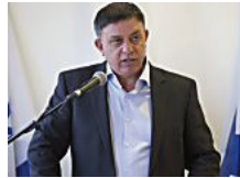
חדשות התפקיד החדש של אבי גבאי