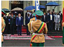
זירת הדעות ישראל מתחילה לגלות את אפריקה