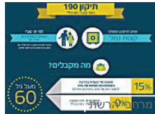
מוטיקה בני +50 הפנסיה באופק: הגיע הזמן שתכירו את תיקון 190 <<