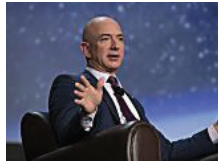
גלובל חילופי דורות: ג'ף בזוס עקף בעושרו את וורן באפט; שווי פייסבוק יותר משווי ברקשייר התאווי