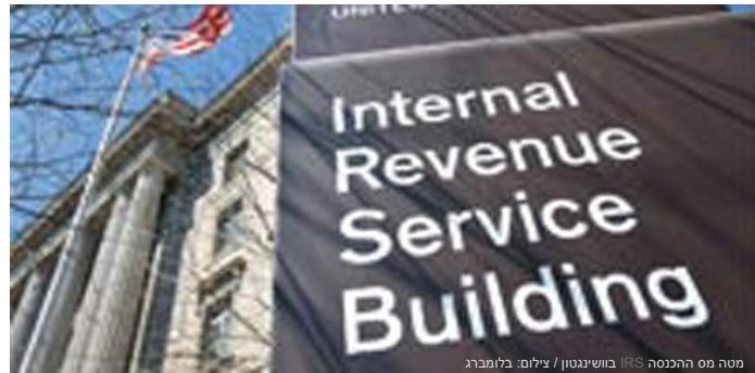
מטה מס ההכנסה IRS בושינגטון