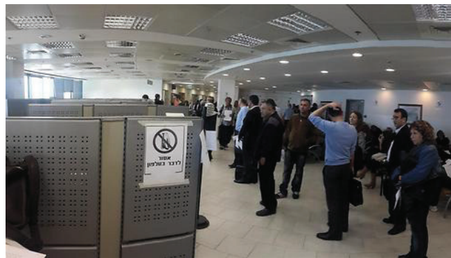
תורים בלשכת הטאבו

לדברי שרת המשפטים, איילת שקד, "השנה היא 2016 ועד היום היינו בנייניזט מבחינה טכנולוגית. כעת אנו יוצאים במהלך שמתאים את הטאבו לעידן הטכנולוגי. מהלך זה יפחית תורים, יוריד עומס, יפחית את משך ההמתנה בלשכת המקרקעין ויקל על הליך רכישת דירות. במצב הקיים, הדבר יקל את הנטל גם בנושא זה".